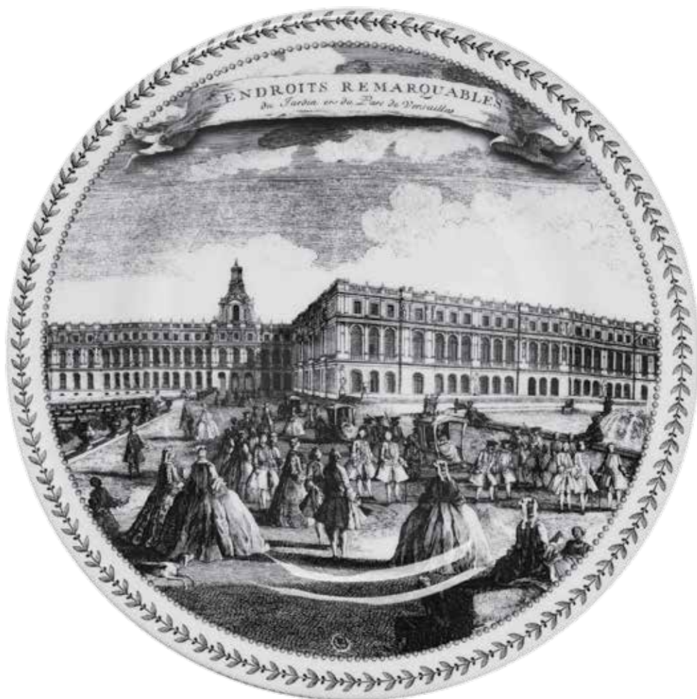
Endroits remarquables - Château de Versailles

La série Endroits remarquables par exemple, reprend des gravures anciennes de vues du Château de Versailles. La collection Les Châteaux de la Loire, nous invite à longer le fleuve à la découverte de ses châteaux historiques. Les assiettes à thème témoignent ainsi de moments, lieux et personnages historiques français.