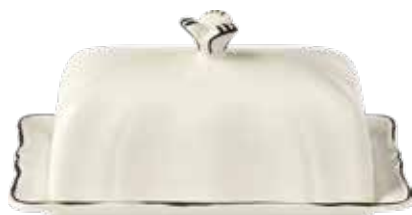
Beurrier souligné d’un filet manganèse peint à la main. Bouton fleur garni et peint à la main. Butter dish with a hand painted manganese net. Hand painted flower button.

Il existe plus d’une dizaine de couleurs de Filets, toutes développées et fabriquées dans un laboratoire interne à la Faïencerie.