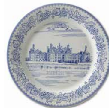
Assiette mignardises "Chambord", collection Châteaux de la Loire.

"Chambord" mignardises plate, Châteaux de la Loire collection.