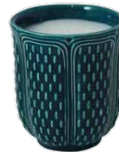
Bougie parfumée senteur Rêve d'Orient. Scented candle fragrance Oriental Dream.

"J'ai toujours aimé les soieries. Quand je lui rendais visite dans la pénombre de son atelier, je m'enveloppais dans les étoffes... Elles étaient légèrement parfumées, délicat mélange d'ambre et d'épices."