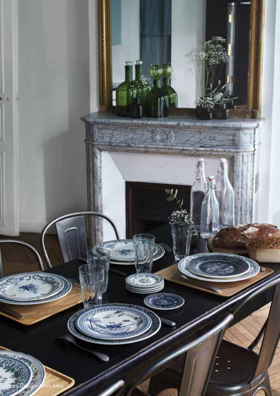
Les Dépareillées bleu