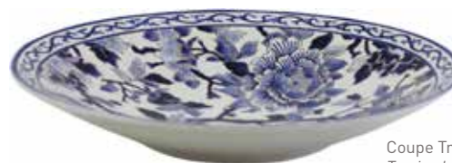
Coupe Trévisse, dans une variation bleue de Pivoines. Trevisse bowl, in a blue variation of "Pivoines".

Depuis 1875, Gien fait vivre la fleur de Pivoines. Ce décor éponyme célèbre la nature et met en lumière le savoir-faire de la Faiencerie.