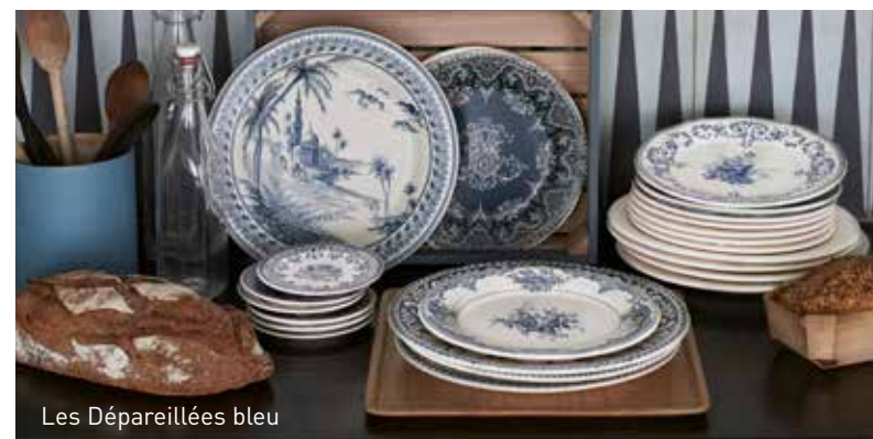
Les Dépareillées bleu

Aujourd'hui, la Faïencerie de Gien est reconnue pour ses collections d'art de la table, mêlant élégance et convivialité, ainsi que pour ses pièces décoratives, délicates et actuelles. Un service dressé sur la table de la salle à manger, une bougie parfumée dans la chambre, une table basse dans le salon... La faïence déploie ses couleurs et motifs au fil des pièces de vie pour créer des moments de bonheur, de partage, des instants magiques.