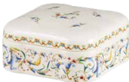
Bonbonnière Toscana. Candy box Toscana.

Quant à Toscana, ce décor s'inspire de modèles d'archives créés en 1875, dont les racines puisaient au cœur de la Renaissance italienne.