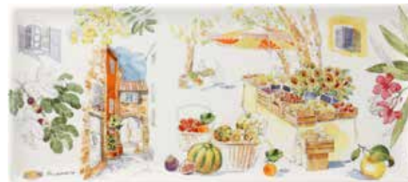
Plat à cake Provence. Oblong serving tray Provence.

Pleinement ancrée dans son territoire, la Faïencerie de Gien a toujours cherché l'inspiration au-delà de son territoire. La curiosité l'a amenée à s'intéresser à différents lieux et cultures, au travers du voyage. Les motifs et les couleurs venus d'ailleurs, apportent un exotisme qui sied à merveille à sa faïence fine.