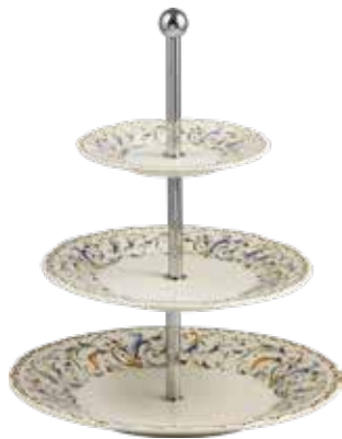
Serviteur muet Toscana. Toscana three-tier cake stand.

Le serviteur muet permet de présenter les canapés en bas pour la partie salée, en haut pour la partie sucrée. Jolie pièce décorative, le serviteur muet peut aussi servir de coupe à fruits ou de simple élément décoratif sur une table ou un buffet.