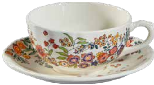
Tasse et soucoupe à déjeuner Poésie. Breakfast cup & saucer Poésie.

Le motif floral est récurrent dans les collections de Gien, et ce depuis les débuts. L'aspect chaleureux de la faïence, ainsi que sa capacité à révéler des couleurs chatoyantes, permet aux fleurs de s'épanouir au gré des formes, créant un univers empli de délicatesse et de ravissement.