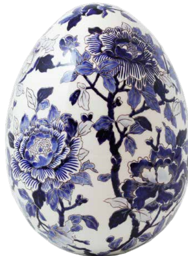
Œuf décoratif, Pivoines peintes à la main dans le bleu de Gien. Decorative egg, hand painted peonies in Gien blue.

Gien blue, or Renaissance blue, can be found in contemporary creations. In 2015, the Pivoines Bleues vase appeared, a monochrome version of the famous Pivoines design of 1875, with opulent multicoloured flowers. In 2016, the Indigo collection came out: the ceramist Brigitte de Bazelaire transformed the Rouen 32 dinner service in which she ate as a child. In 2023, the designer Jean-Charles de Castelbajac immersed himself in Gien blue with the L'Archipel Sentimental pattern, the idea being to create bridges between the past and the present, by mixing this contemporary pattern with the historical themes of Gien, such as Pivoines Bleues, Filets bleu or Dépareillées Bleu.