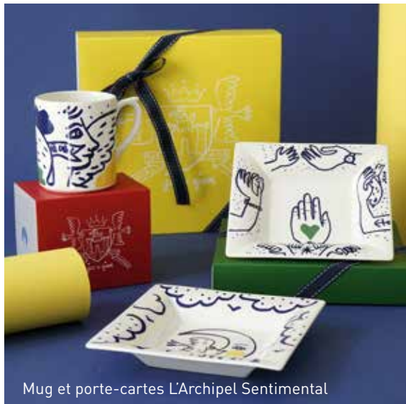
Mug et porte-cartes L'Archipel Sentimental

L'art de faire plaisir. De jolies pièces cadeaux sont proposées dans l'ensemble de nos cinquante décors, de quoi plaire à toutes les sensibilités. Présentées dans leurs jolis écrins, les pièces Gien sont toujours perçues comme de délicates attentions.