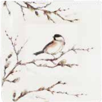
Porte-cartes grand modèle Les Oiseaux de la Forêt. Square candy tray Les Oiseaux de la Forêt.

Nichée au cœur du Loiret, bordé par les forêt de Sologne, la Faïencerie a un fort attachement à la thématique de la nature et en particulier des animaux. La faune et la flore de la région évoluent au fil de la faïence, invitant à découvrir un lieu naturel riche et sauvage.