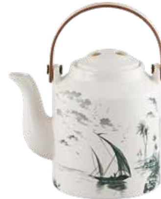
Théière japonaise avec anse en bois Les Dépareillées vert. Japanese teapot with wooden handle Les Dépareillées green.

Gien propose un service de table dépareillé avec des motifs iconiques issus de ses archives du 19e siècle. L'heure n'est plus à l'uniformité, mais à la table dépareillée, rappelant les dimanches à chiner dans les brocantes ou à fouiller les placards de grands-mères... Dans un esprit tout aussi vintage que raffiné, Les Dépareillées, dans les tons bleu ou les tons vert, créent une table insolite et unique.