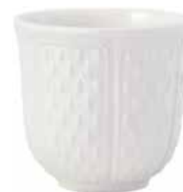
Gobelet espresso Pont aux Choux. Espresso cup Pont aux Choux.

La finesse de la pâte permet de réaliser des pièces emblématiques aux reliefs extrêmement fins : des volutes et des godrons en tourbillons, des boutons de couvercles en forme d’artichauts et le célèbre motif du semis de grains de riz.